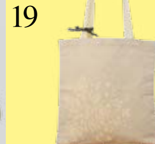
19 FUNDSTÜCKE MIT SWISSNESS

Traditionelles Schweizer Handwerk, gepaart mit modernem Design: Das ist die Idee hinter dem Online-Shop Matrouvaille. Die Produkte werden aus Holz, Papier, Leder oder Leinen in der Schweiz gefertigt. Da gibt es Tischsets mit einer herausklappbaren Blumenwiese, Holzpostkarten, Kofferetiketten mit Alpaufzug oder den Leinenbeutel für CHF 64.- (im Bild) mit einem aufgedruckten Ornament – so sieht herkömmliche Bauernmalerei zeitgemäss umgesetzt aus. www.matrouvaille.ch