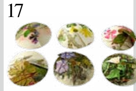
17 DAS IST MEIN WEIN! Verwechslung ausgeschlossen: Weinglas-Manschetten aus alten Büchern und Heften. www.markt-luecke.ch , 8 Stück CHF 8.50