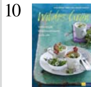
10 HEXENKÜCHE Wildpflanzen und -beeren lassen sich auch in der Küche verwerten. Das Kochbuch «Wildes Grün» zeigt wie. AT Verlag CHF 32.90