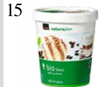
15 EISKALTE LATTE Für Kaffee ist es jetzt zu heiss, dafür gibts von Naturaplan das Bio-Glace Caffè macchiato, Fairtrade-zertifiziert. Coop, 460 ml CHF 5.20