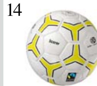
14 FAIRNESS IM SPORT Fussball «Scorer Fairtrade» mit Max-Havelaar-Zertifikat, in den Grössen 4 und 5. Von Alder+ Eisenhut. www.alder-eisenhut.ch CHF 42.-