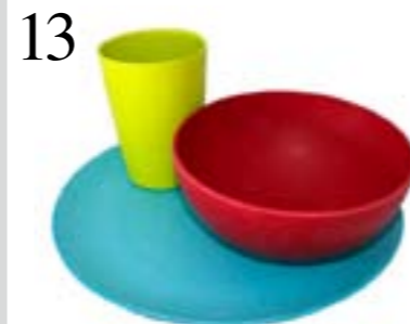
13 DRAUSSEN ESSEN Robustes Ökogeschirr «Rubytec Panda Bamboo», in drei Farben, spülmaschinenfest. Bei Transa, Sportxx oder Hajk, ab CHF 6.50