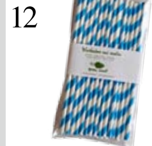
12 SCHLÜRF... Für grosse und kleine Kinder: Trinkhalme von Green Mood aus Papier, in sechs Farben. Bei Changemaker, 25er-Pack CHF 8.50