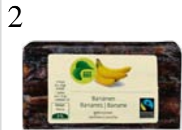
2 PROVIAANT FÜR EINE WANDERUNG Bio-Bananes, getrocknet, Max-Havelaar-Fairtrade-zertifiziert. Erhältlich in allen grösseren Migros-Filialen CHF 3.80