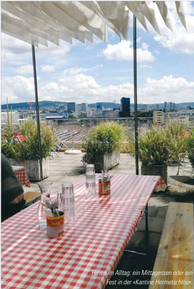
Ferien im Alltag: ein Mittagessen oder ein Fest in der «Kantine Hermetschloo».

Das Restaurant «Kantine Hermetschloo», zum Glück genussvoll Gaumenfreude, Augenweide und ab und zu sogar Ohrenschaus. Gekocht wird sehr abwechslungsreich, frisch und saisonal. Die Atmosphäre ist herzlich und unkompliziert und die Aussicht von der grossen Terrasse über die Stadt bis in die Alpen ist schlicht umwerfend. Offen für Jedefrau und Jedermann wochentags, von 9 bis 16 Uhr. An den Wochenenden können die Räume für Anlässe und Feste gemietet werden. Sporadisch werden kulturelle Anlässe organisiert. Die Fiiirabigbar oder das Tanzfest FunkÄt-