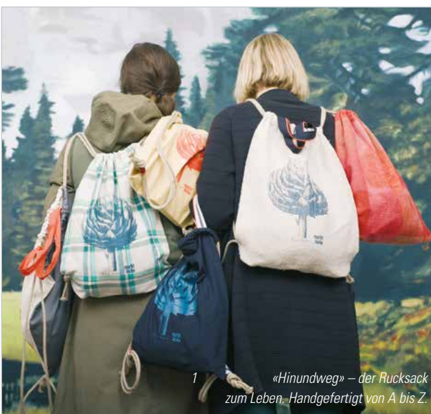
1 «Hinundweg» – der Rucksack zum Leben. Handgefertigt von A bis Z.

Das Restaurant «Kantine Hermetschloo», zum Glück genussvoll Gaumenfreude, Augenweide und ab und zu sogar Ohrenschaus. Gekocht wird sehr abwechslungsreich, frisch und saisonal. Die Atmosphäre ist herzlich und unkompliziert und die Aussicht von der grossen Terrasse über die Stadt bis in die Alpen ist schlicht umwerfend. Offen für Jedefrau und Jedermann wochentags, von 9 bis 16 Uhr. An den Wochenenden können die Räume für Anlässe und Feste gemietet werden. Sporadisch werden kulturelle Anlässe organisiert. Die Fiiirabigbar oder das Tanzfest FunkÄt-