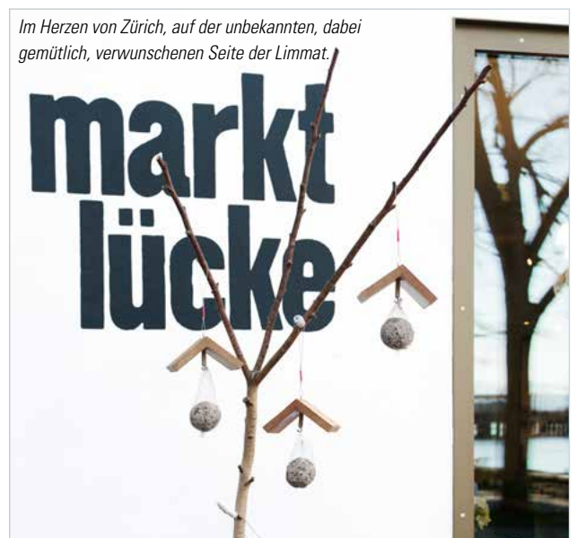
Im Herzen von Zürich, auf der unbekannteren, dabei gemütlicher, verwunschenen Seite der Limmat.