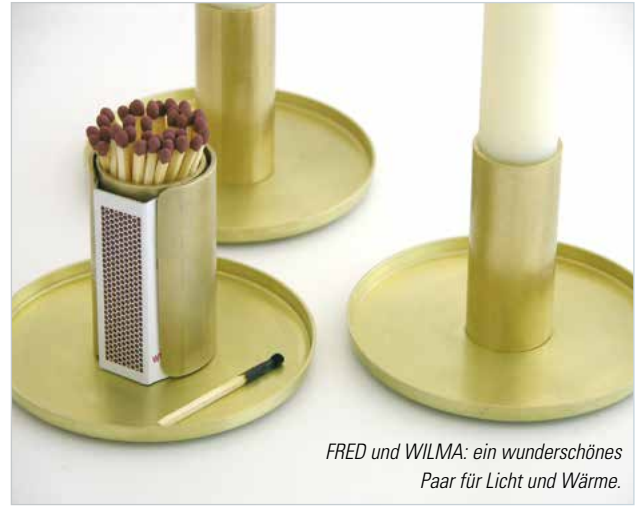
FRED und WILMA: ein wunderschönes Paar für Licht und Wärme.

Schloo sind Beispiele, die sich vom Geheimtipp zum Publikumslieblich herumgesprochen haben.