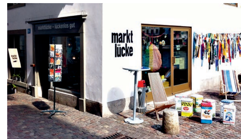
«Die Marktlücke» an der Schipfe verkauft handgefertigte Produkte aus kleinen Manufakturen.