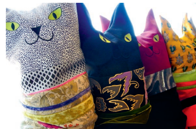
Nackenkissen: Die Innenkissen sind mit Dinkelspreu gefüllt.